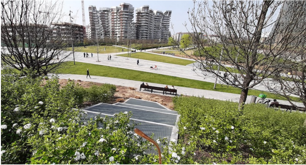
Milano, City Life

(Si veda anche Sentieri Metropolitan ( http://www.sentierimetropolitani.org ), un progetto di Trekking Italia)